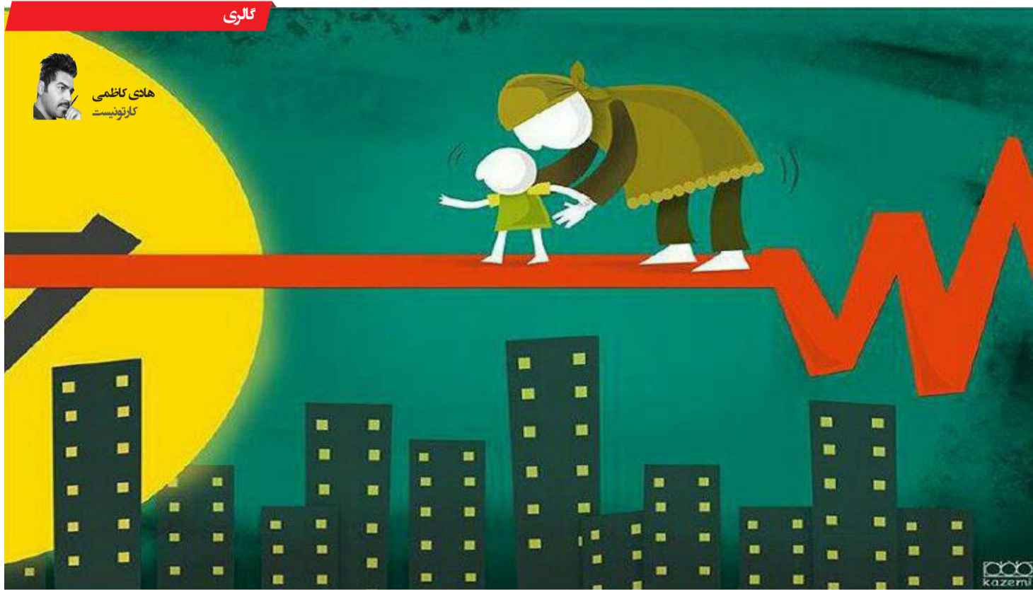
هلنی کاظمی کارتونیست