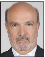
حمایت از واحدهای تولیدی به رفع بیکاری کمک خواهد کرد

امروز مبارزه با بیکاری هدف و اراده دولت است و من کاملاً این موضوع را لمس می‌کنم. طرح‌های خوبی در بودجه از سوی دولتمردان برای رفع بیکاری و ایجاد شغل مطرح شده که امیدوارم طرح‌ها به مرور در سال آتی عملیاتی شود و در تخصیص منابع مشکل خاصی پیش نیاید زیرا مهم‌تر از بودجه نوشتن، اجرای آن است و با تحرک و پویایی که در دولت است امیدواریم همان‌طور که آقای روحانی قول دادند در ایجاد منابع بودجه مشکلی پیش نیاید تا به برنامه‌های خود جامه عمل بپوشانند. نگرانی من به عنوان یکی از نمایندگان مردم، بیکاری جوانان و مخصوصاً تحصیلکرده‌ها است. اکثر جوانان ما از تحصیلات خوبی بهره‌مند هستند و دارای استعداد و توانایی‌های قابل ملاحظه‌ای می‌باشند و نباید برای گذران زندگی خود روزها و شب‌ها دغدغه شغل را داشته باشند. ما برای آبادانی کشور نیازمند به پتانسیل این قشر پرشور هستیم و ان‌شا... آقای رئیس‌جمهور طبق وعده خود در دوران تبلیغات انتخابات ریاست جمهوری که به جوانان قول بکارگیری در بخش‌های مختلف دولت را داده بودند عمل کنند تا هر سال شاهد رشد و بالندگی کشور به دست این آینده‌سازان باشیم.