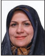
نگاه ویژه به اشتغال در بودجه سال ۹۷ سیده فاطمه ذوالقدر

دارد در سال ۹۷ تا جایی که توان دارد دولت را در جهت اشتغال‌زایی یاری دهد زیرا مردمی که فاقد شغل هستند و خصوصاً جوانان و تحصیلکرده‌ها از همه مسئولین انتظار دارند تا فضایی را برای آن‌ها ایجاد کنند تا بتوانند از توانایی و دانش خود استفاده کنند. حقیقتاً انتظار به حقی است و ما باید بستری را مهیا کنیم که همه افراد بتوانند از توانایی و تخصصشان استفاده کنند. توجهی که به اشتغال در بودجه سال آینده شده بسیار خاص است به طوری که حتی این نگاه ویژه در بودجه سال ۹۶ نبود.