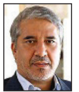
لایحه دولت برای رفع بیکاری امیدوارکننده است

برنامه اشتغال فراگیر با هدف ایجاد ۹۷۱ هزار شغل در سال ۹۶ ابلاغ شد. براساس اهداف کمی که در این برنامه تعیین شده، بخش صنعت و معدن موتور اصلی تولید شغل در سال جاری با سهم ۲۶ درصدی است. طرح کارروزی فارغ‌التحصیلان و بخش فناوری اطلاعات و ارتباطات نیز به ترتیب مسوول تامین ۹ و ۱۰ درصد از شغل‌های جدید سال ۹۶ بودند. در این بخشنامه تامین ۹۳ درصد از کل منابع مالی مورد نیاز ایجاد شغل در سال جاری، بر دوش شبکه بانکی بود. معاون اول رئیس‌جمهوری و رئیس ستاد فرماندهی اقتصاد مقاومتی «برنامه اشتغال فراگیر در سال ۱۳۹۶» را به کلیه دستگاه‌های اجرایی ابلاغ کرد. در همین رابطه به سراغ نمایندگان مجلس دهم رفتیم تا نظر آنان را پیرامون وضعیت اشتغال در سال پیش رو جویا شویم: