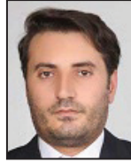
خبرهای خوبی در راستای اشتغال‌زایی در راه است

مالی نمی‌شود بلکه بُعد روحی و روانی آن به اندازه موضوع مالی اهمیت دارد و زمانی که افراد جامعه دارای شغل باشند آسیب‌ها و ناهنجاری‌های اجتماعی به حداقل خواهد رسید و این یک برگ برنده برای دولت‌ها است. در بودجه سال ۹۷ دولت برای کمک به صنعت و صادرات حداکثری، فکرها را اساسی کرده است که مطمئناً اگر این روال درست پیش برود در نهایت منجر به اشتغال‌زایی خواهد شد.