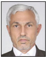
رفع بیکاری، همکاری همه قوارا می‌طلبند

نماینده پاکدشت و شریف آباد اشتغال با تولید توأم است و اگر تولید روند مثبت را دنبال کند به تبع آن مشکل اشتغال هم به حداقل خواهد رسید. برای به نتیجه رسیدن اشتغال فقط تخصیص بودجه کافی نیست بلکه بهبود فضای کسب و کار موضوعی مهم‌تر است. در بودجه ۹۷ پیش‌بینی‌های اساسی برای اشتغال‌زایی در کشور شده است و امیدوارم آینده‌نگری‌های دولت زیر سایه نظارت نمایندگان به سرانجام خوبی برسد و جوانان ما در سال پیش‌رو اخبار خوبی را دریافت کنند. دولت فکرها را ریشه‌داری برای تولید هرچه بیشتر کرده و همین خود می‌تواند دلیلی بر تحقق اشتغال‌زایی در سال آینده باشد. در حال حاضر جوانان بیکار زیادی در کشور وجود دارند که بسیاری از آن‌ها از تحصیلات دانشگاهی هم برخوردار هستند و این اتفاق خوبی برای کشور ما نیست. باید فضایی در جامعه ایجاد شود که بتوانیم از همه نیرو و پتانسیل جوانان در حوزه‌های مختلف کشور استفاده کنیم و مطمئناً اگر این موضوع مدیریت شود شاهد شکوفایی اقتصادی کشور خواهیم بود. دولت یازدهم تلاش‌های موثری را در جهت رفع بیکاری کرد و به نظر می‌رسد آقای رییس‌جمهور برای تحقق وعده‌های انتخاباتی خود عزمش را برای اشتغال هرچه بیشتر جوانان جزم کرده است. تیم اقتصادی دولت وظیفه سنگینی در این رابطه دارد و باید چالش‌های پیش‌رو را، مورد به مورد بررسی کند زیرا مردم و مخصوصاً خانواده‌هایی که در خانه خود با افراد بیکار مواجه هستند منظر اخبار خوش از طرف دولتمردان هستند. بنده به عنوان یکی از نمایندگان مجلس شاهد تحرک و سر و سامان دولت برای رونق اقتصادی هستیم و اگر کار همین طور جدی پیش برود حتماً در سال‌های آتی به کاهش نرخ بیکاری دست خواهیم یافت.