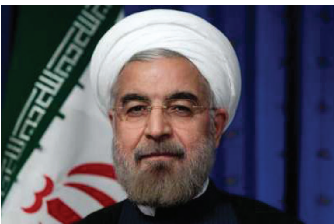
حسن روحانی، رئیس‌جمهور ایران

مصرف بالای انرژی، تاثیرات سوء فعالیت برخی نهاده‌ها در اقتصاد و… در دیگر حوزه‌ها به ویژه حوزه محیط زیست باید پنجه می‌انقباط می‌کنند. انتخابات ریاست