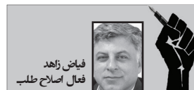
فیاض زاهد فعال اصلاح طلب

از فردای پیروزی انقلاب اسلامی یک جریانی به دنبال این بود که از آن قطار با واگن‌های بسیار متعدد و طولانی تنها یک کوبه باقی بگذارد و این به معنی محدود کردن ارزش‌های نظام سیاسی است که به خاطر آن به هر حال یک انقلاب با شکوه شکل گرفت که بسیاری از گروه‌های سیاسی و جریانات در آن شریک بودند. بنا بود در این نظام سیاسی مارکسیست‌ها آزاد باشند و تئوریسین و ایدئولوگ آن‌ها می‌گفت که در دانشگاه‌های الهیات نه تنها باید مارکسیسم درس داده شود که باید این درس توسط مارکسیست‌ها انجام شود. حال آن‌ها رسیده‌اند به نقطه‌ای که حتی بسیاری از نیروهای درون انقلاب را هم به رسمیت نمی‌شناسند؛ و هیچ ابایی ندارند از اینکه رییس‌جمهور و وزیر خارجه را جاسوس بنامند به نظر من بیش از آنکه نشانگر صحت اراده انقلابی آنهاست باید به آن‌ها با دیده تهدید نگریست و دست سرویس‌های امنیتی بین‌المللی را در این تشکیلات دنبال کرد.