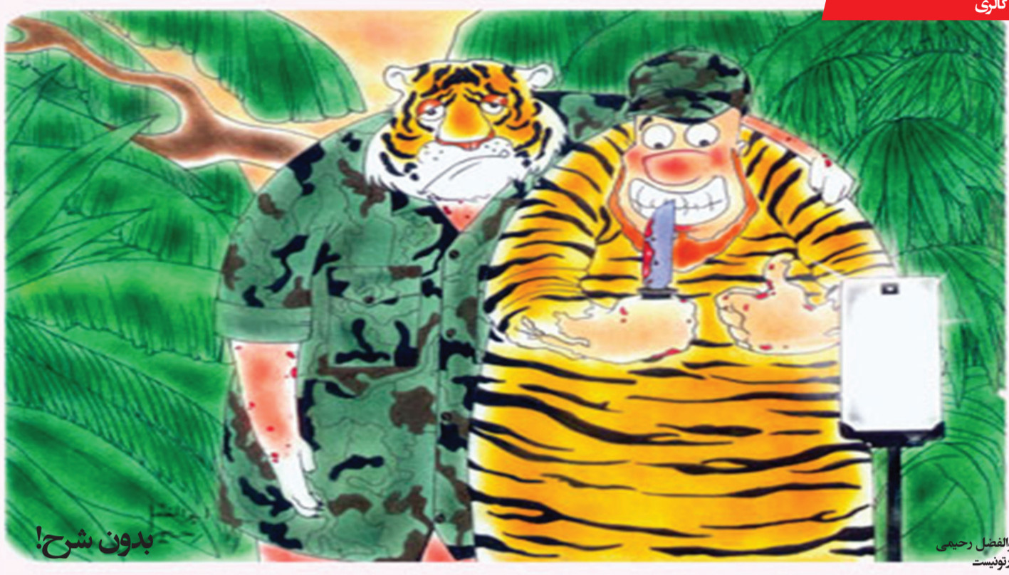
ابوالفضل رحیمی کلر نویسنده